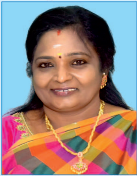
माननीय डॉ. तमिलसाई सौंदरराजन राज्यपाल, तेलंगाना