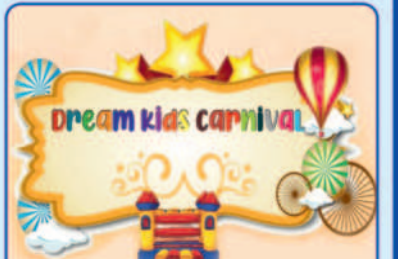
Dream Kids Carnival क्लासिक कन्वेंशन सेंटर III, शमशाबाद