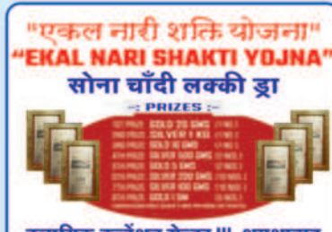
"एकल नारी शक्ति योजना" "EKAL NARI SHAKTI YOJNA" सोना चाँदी लक्की झा क्लासिक कन्वेंशन सेंटर III, शमशाबाद