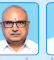
मधुसूदन साँवालिया अध्यक्ष : रानी सती मन्दिर