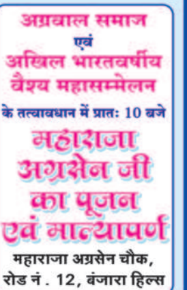
अग्रवाल समाज एवं अखिल भारतवर्षीय वैश्य महासम्मेलन के तत्वावधान में प्रातः 10 बजे महाराजा अग्रसेन जी का पूजन एवं मादध्यापन महाराजा अग्रसेन चौक, रोड नं. 12, बंजारा हिल्स