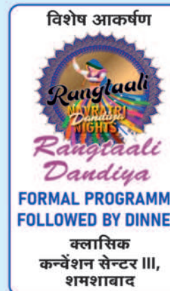
विशेष आकर्षण Ranglaali Dandiya FORMAL PROGRAMME FOLLOWED BY DINNER क्लासिक कन्वेंशन सेंटर III, शमशाबाद